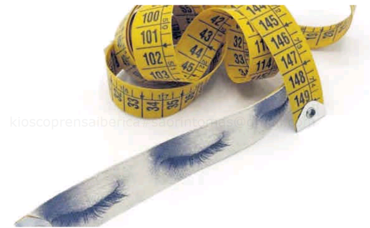
Una de las obras que forman parte de 'Lo-Fi'.

El nombre de Lo-Fi ('low fidelity', baja fidelidad), responde a la escasez de medios usados; los materiales empleados son generalmente encontrados y domésticos que se intervienen en un proceso de elaboración inmediata. Muchos de esos objetos se destruyen y dejan de existir después de ser fotografiados. En la exposición se podrán ver gran parte de ellos.