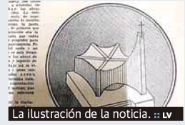
La ilustración de la noticia. :: LV

3.800.000 pesetas. Este edificio, con forma de pentágono, tendría una capacidad para acoger a «varios miles de personas». La ermita contaría con un aparcamiento en sus inmediaciones y con zonas ajardinadas. Por esta razón, los vecinos pensaban que podría convertirse en «el pulmón de Molina».