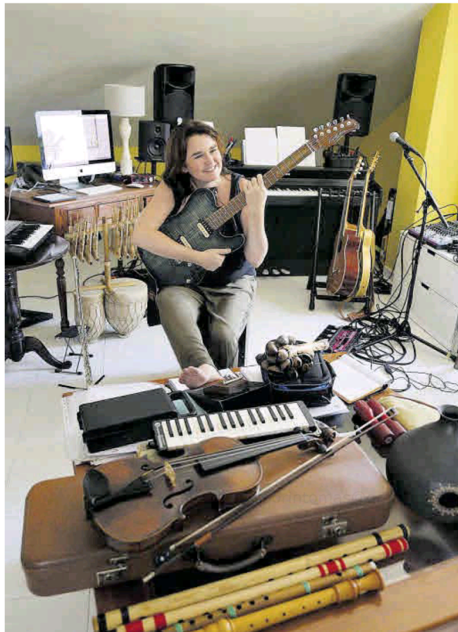
En su taller de El Verdolay.

Entre sus cambios de domicilio, estudió en el Conservatorio Superior de Salamanca, donde se licenció en Musicología, posteriormente hizo Magisterio Musical en la Universidad de Murcia y Máster en Investigación Musical, con ampliación de estudios que van desde la formación clásica hasta el jazz. Se pasó de la flauta de pico a la flauta