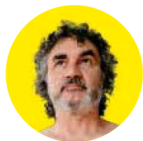
Texto y foto JAVIER LORENTE

travesera y ha seguido aprendiendo en talleres y cursos de improvisación, paisaje sonoro, etc. Y me cuenta: «En los conservatorios te enseñan a ceñirte a la partitura, pero yo nunca me dejé atrapar, siempre me gustó investigar y adentrarme por caminos nuevos, andar por libre. Yo siempre he ido por libre, dejándome llevar por la improvisación».